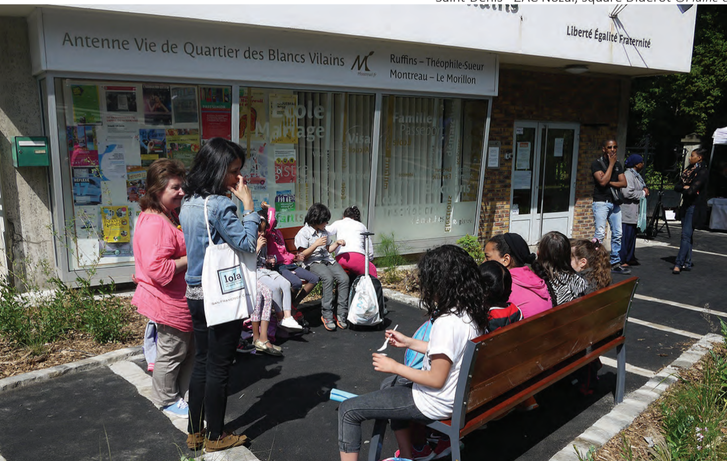
Montreuil - Pepa ©silva-landscaping

Dans certains cas ce sont DES ESPACES PUBLICS où les habitants deviennent acteurs (appels à initiatives pour s'approprier des espaces (Montreuil : Petits Espaces de Proximité Aménagés...))