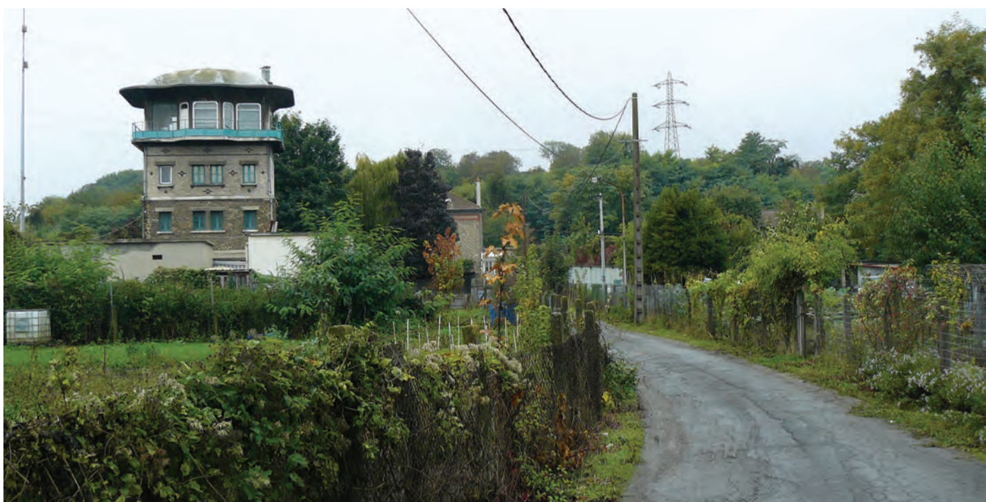
Neuilly sur Marne - «petit bijou»

Le département de la Seine-Saint-Denis, en raison de l'ampleur et de la diversité des surfaces concernées par la désindustrialisation, est particulièrement riche en espaces et lieux qui présentent ce type de qualités paysagères.