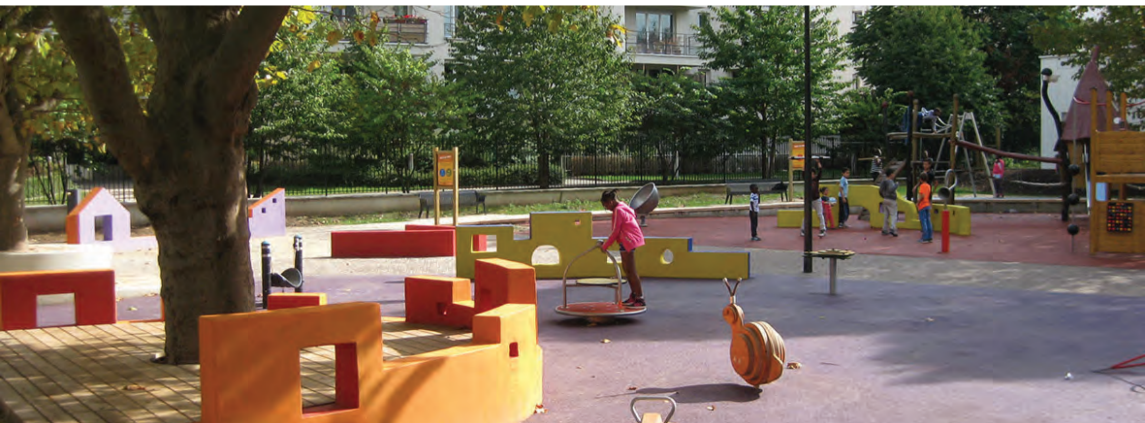
Saint-Denis - ZAC Nozal, square Diderot : l'intensité des aires de jeux

- Les faubourgs : un caractère vivant résultant de l'imbrication de différentes fonctions (habitat, artisanat, activité, commerce ...) qui favorisent, par l'animation urbaine liée à la superposition des fonctions et à la variété des usages, des échanges riches et diversifiés.