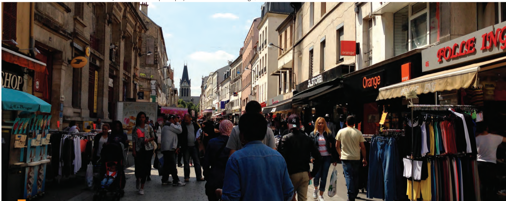
Saint-Denis - rue de la République, l'intensité du centre-ville