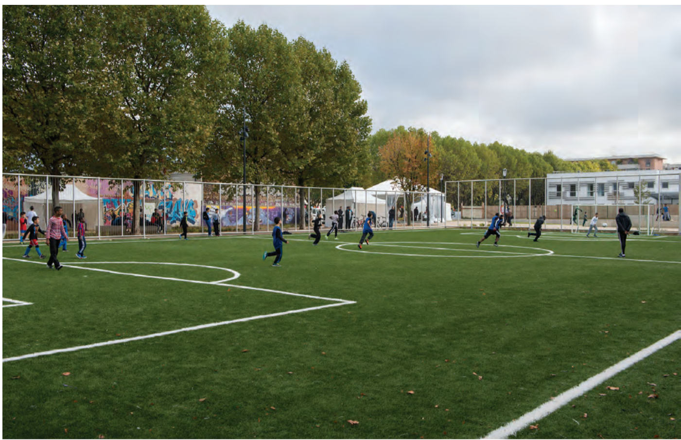
Saint-Denis - ZAC Nozal, square Diderot

LES PARCS URBAINS sont les lieux les plus significatifs par leur diversité : Parc de la Légion d'Honneur à Saint-Denis, parc des Docks à Saint-Ouen, parc Jean Moulin les Guilands et parc des Beaumonts à Montreuil, Parc Henri Barbusse à Romainville, parc Jacques Duclos au Blanc-Mesnil),