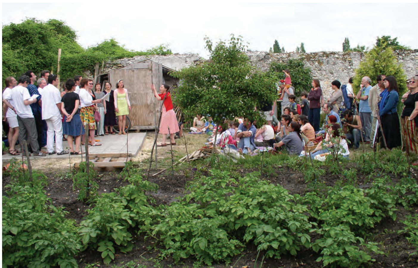
Montreuil - mur à pêches

D'AUTRES ESPACES, TERRAINS DE SPORTS, JARDINS FAMILIAUX, JARDINS PARTAGÉS, accessibles au quotidien, portent l'intensité associée à des activités de groupes, familiaux, sportifs, associations qui « fabriquent » des espaces et des ambiances paysagères très typées, de petite échelle et très appropriés.