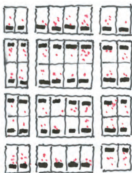
Schéma «intensité des jardins privés dans les quartiers pavillonnaires»