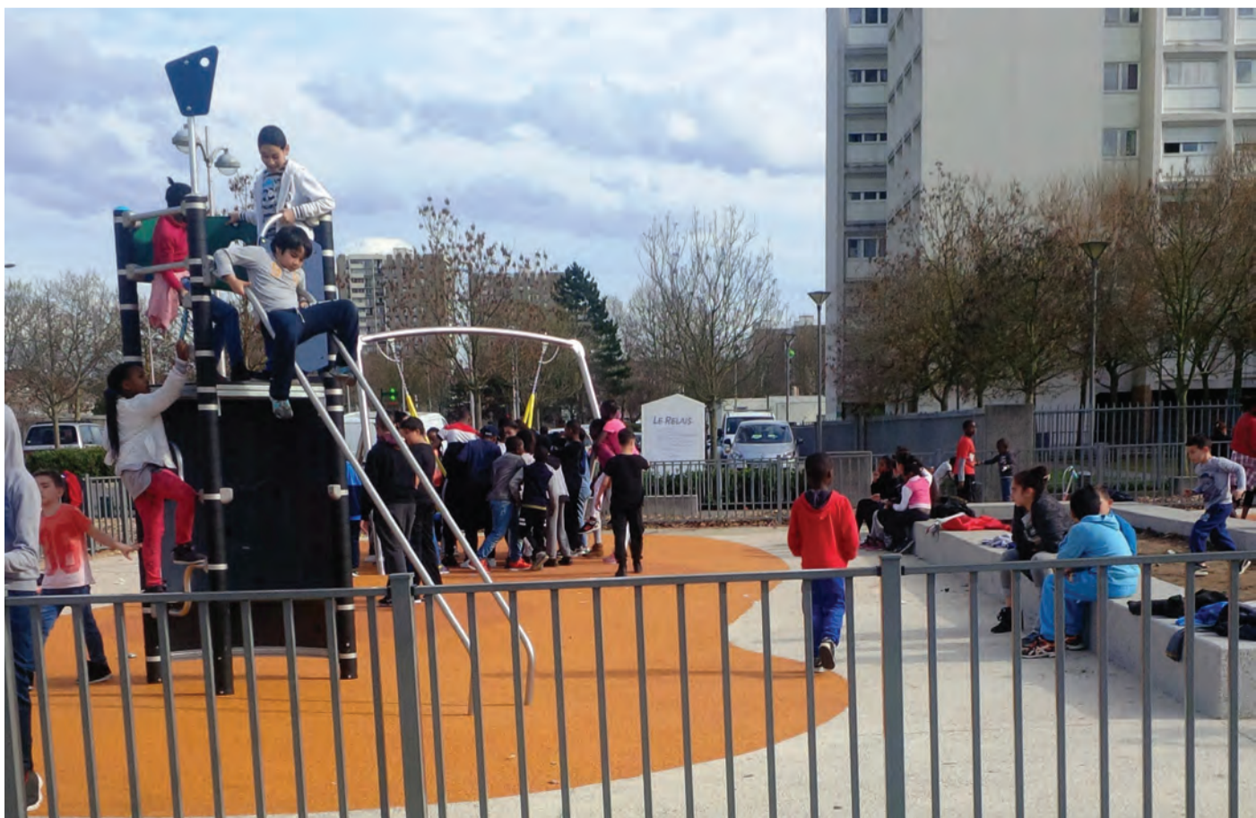
Sevran - quartier Rougemont, aire de jeux

À l'intérieur DES QUARTIERS DE GRANDS ENSEMBLES , l'absence de qualité des espaces extérieurs a longtemps été synonyme d'ennui, d'abandon, de rejet : des espaces non appropriés et sans intensité. Suite à des opérations d'aménagement engagées dans le cadre de l'ANRU, certains d'entre eux sont à nouveau appropriés par les habitants et renouent avec une forme d'intensité.