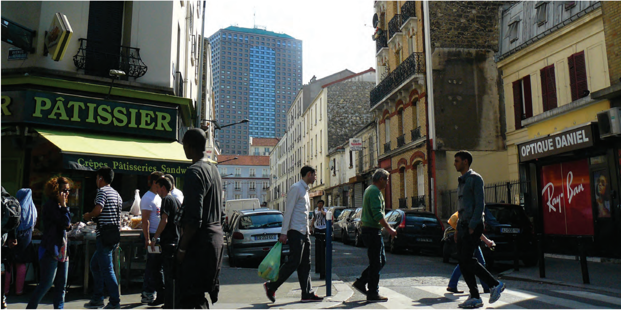
Aubervilliers - rue Henri Barbusse/avenue de la république, l'intensité du faubourg