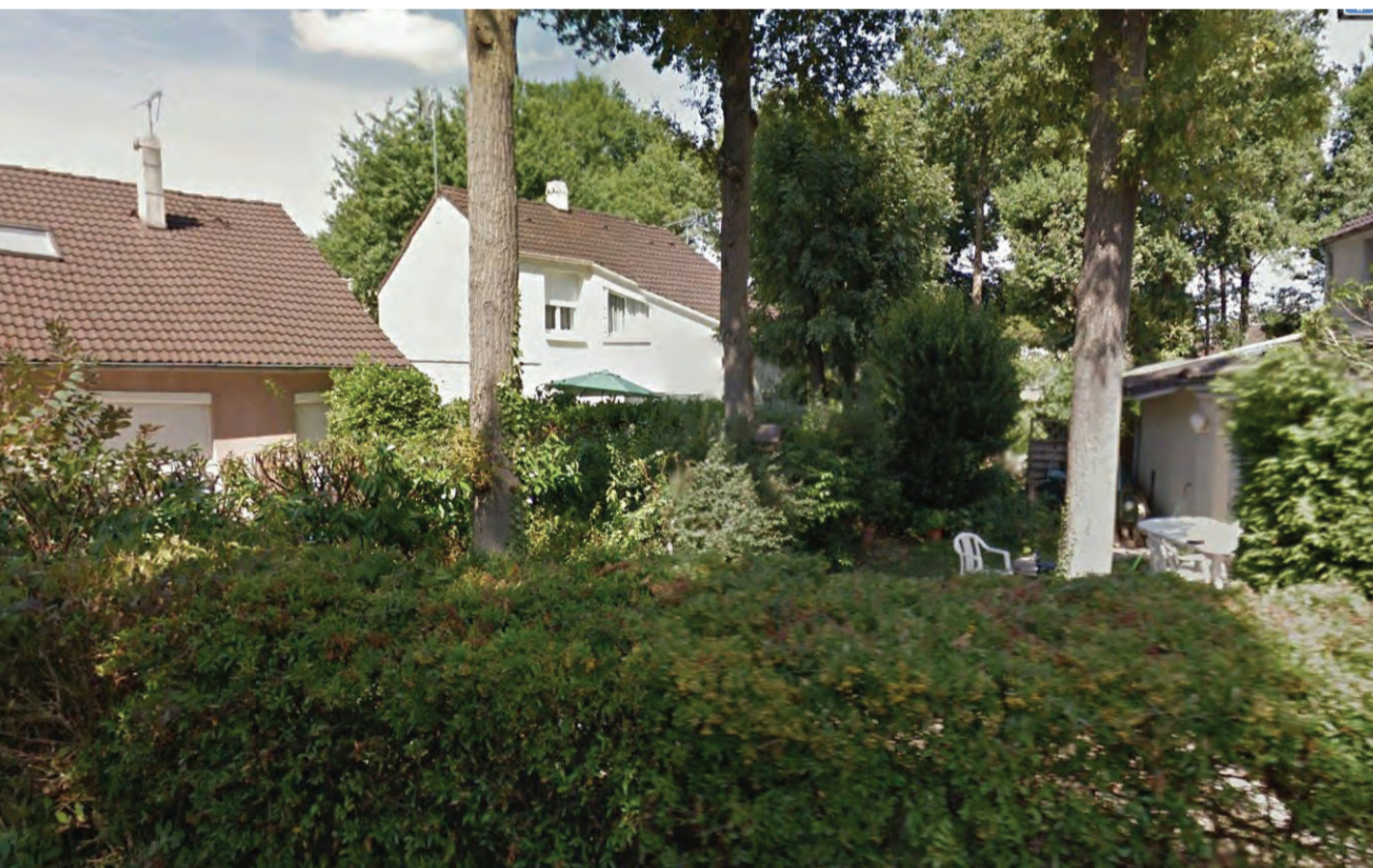
Noisy-le-Grand - quartier des Charmilles, jardin privé

DANS LES QUARTIERS PAVILLONNAIRES, les jardins privés offrent une forme d'intensité en tant que lieux de convivialité et dans l'investissement des habitants pour leur cadre de vie (Cf. : travaux de Bernard Lassus sur les «habitants-paysagistes»)