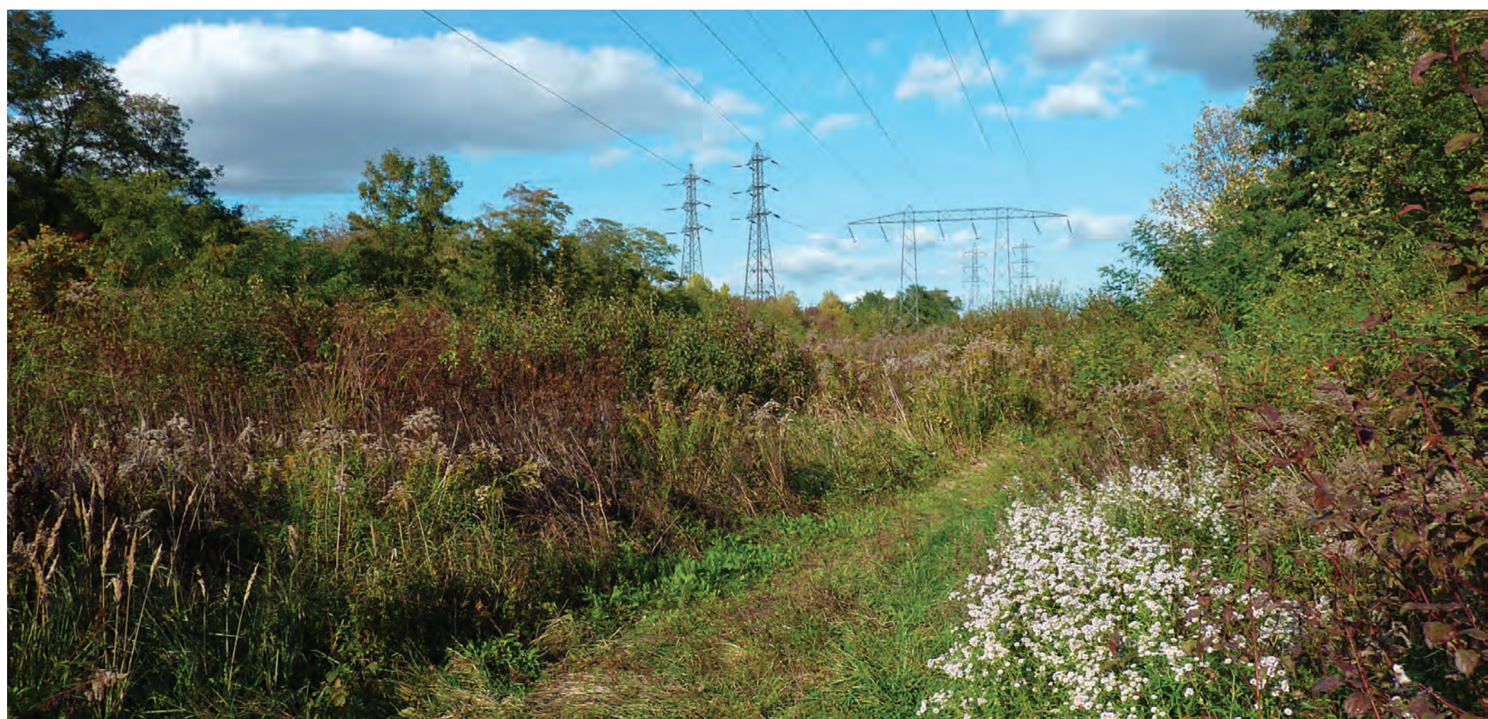
Gagny - friche Montguichet