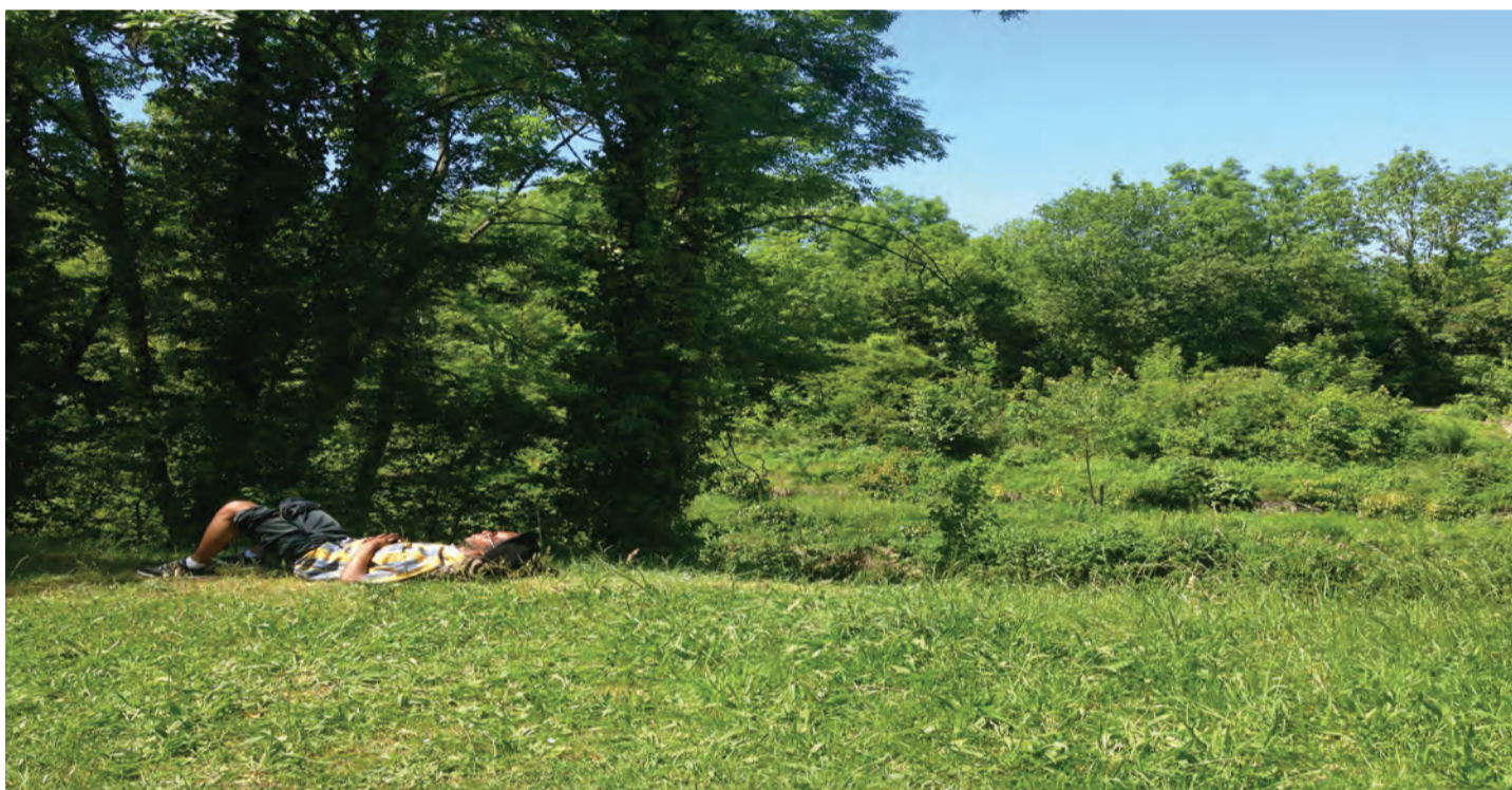
Sevran - abords du canal de l'Ourcq: espace approprié