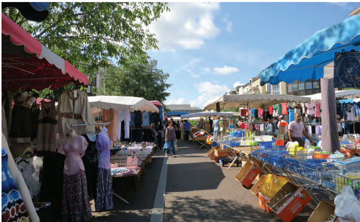
Noisy-le-Grand - intensité du marché forain

CE RESENTI RÉSUITE À LA FOIS DE L'INTERRUPTION PONCTUELLE DE LA TRAME BÂTIE, DE LA QUALITÉ DES AMÉNAGEMENTS, DES AMBIANCES, ET DE LA POSSIBILITÉ D'Y PRATIQUER DES ACTIVITÉS URBAINES (MARCHÉS, FÊTES, RASSEMBLEMENTS) ET/OU DES LOISIRS DE PLEIN AIR (PROMENADE, REPOS, JEUX, SPORTS, DÉTENTE, MÉDITATION...).