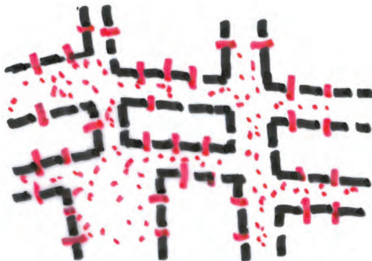
Schéma «intensité espace public» ©Atile